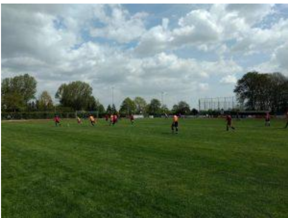
Foto unserer Schulmannschaft.