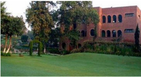
Foto unserer Partnerschule.