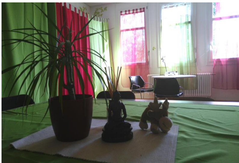
Der neue Entspannungsraum.

Die Ausstattung wurde überwiegend durch Elternspenden an den Förderverein realisiert. Ein herzliches Dankeschön allen Spenderinnen und Spendern sowie die Unterstützung durch Frau Hartmann von den Streitschlichtern!