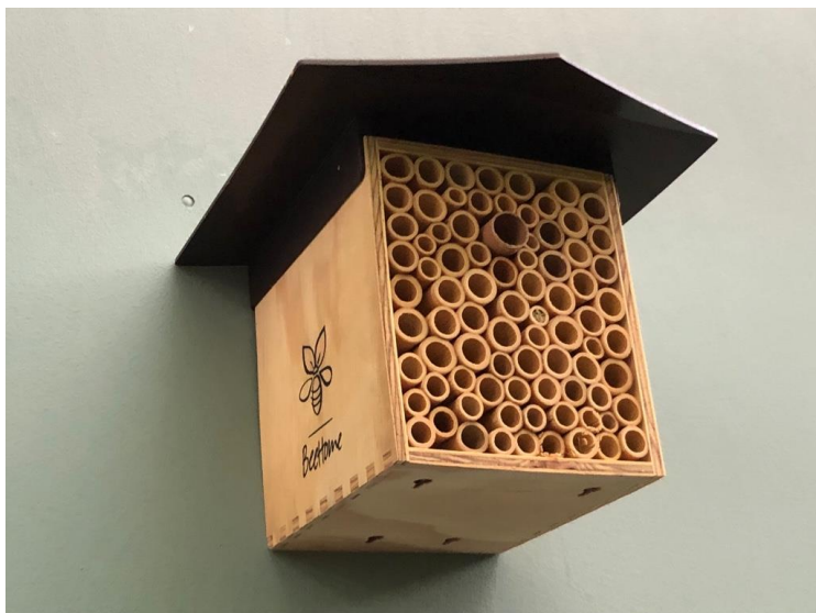
Das Wildbienenhäuschen, Foto: M. Göppel.